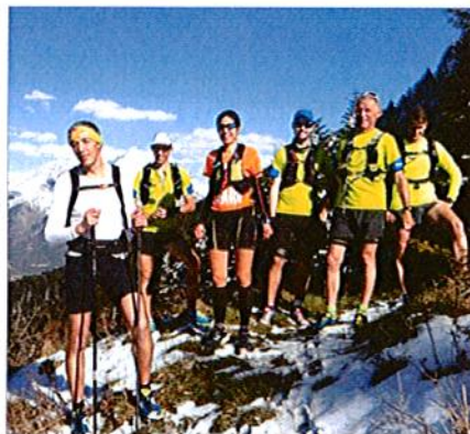
Pour pimenter le stage, les trailers, ont terminé la première journée avec la montée à la tête de la Sambut (1 595 m).

Un pique-nique a clôturé ce week-end de stage, après avoir effectué 75 km et 4 500 m de dénivelé positif sur les deux jours.