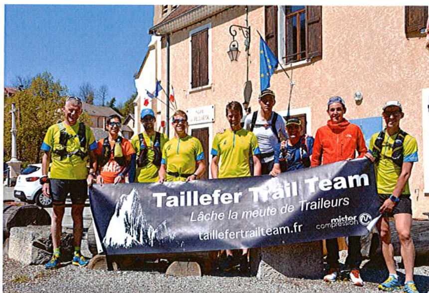
Le team devant la mairie de Pellafol

Le stage organisé par le team les 29 et 30/04/2017 à Pellafol (Isère, http://www.mairie-pellafol.com ) a rencontré un vif succès. 12 personnes ont fait le déplacement.